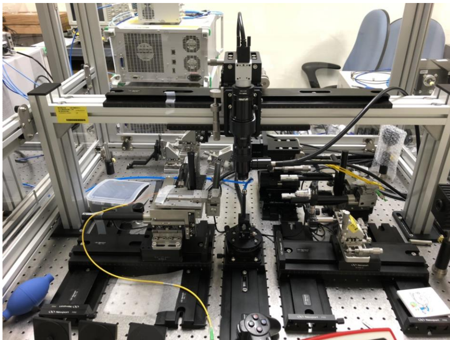
邊緣耦光探針機台。